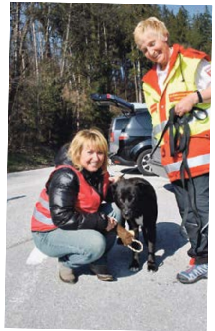
Regelmäßiges Training steht bei den HundeführerInnen des ehrenamtlichen Samariterbundes am Programm.

Bereits zum sechsten Mal ging der Tiroler Freiwilligentag erfolgreich über die Bühne. Organisiert von der Freiwilligenpartnerschaft Tirol gemeinsam mit dem Freiwilligen Zentrum Tirol Mitte, hatten im Rahmen dieses Tages verschiedene Einrichtungen und Organisationen die Gelegenheit, möglichst viele BürgerInnen für Projekte der ehrenamtlichen Arbeit zu begeistern. Den Interessierten stand eine Vielzahl attraktiver Möglichkeiten quer durch alle Tiroler Bezirke zur Wahl.