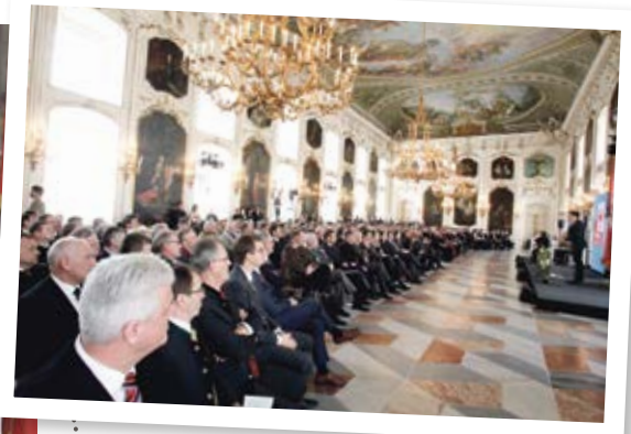
Der Riesensaal der Hofburg in Innsbruck bot den feierlichen Rahmen für die Angelobung der BürgermeisterInnen.