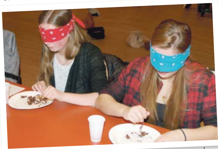
Wie meistern Menschen mit Handicap ihr Leben? Jugendliche erfuhren selbst wie es ist, blind zu essen.