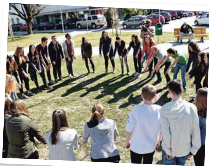
Das Jugendzentrum „space“ der youngcaritas ermutigt junge Menschen: Öffnet die Augen für Notsituationen und werdet selbst aktiv!

Dort wurde nämlich mit Somaliern „bingo!“ gespielt und bald entwickelten sich zwischen ihnen und den rüstigen BewohnerInnen interessante Gespräche. Auf der Weltkarte zeigten die Somalier den SeniorInnen ihr Heimatland.