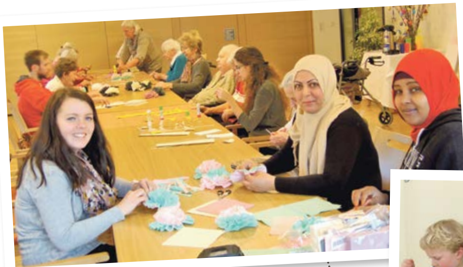
Im Altenwohnheim Innpark arbeiteten alle eifrig an einer blühenden Frühlingsdekoration.