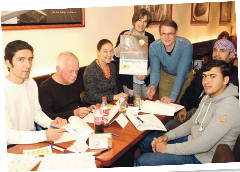
Deutschtraining im Café in angenehmer Atmosphäre – Sprachvermittlung in der Öffentlichkeit sichtbar machen.

OB JUNG ODER ALT – BEIM DIESJÄHRIGEN FREIWILLIGENTAG AM 18. MÄRZ KONNTEN ALLE INTERESSIERTEN TIROLERINNEN UND TIROLER AN PRAXISNAHEN PROJEKTEN DER EHRENAMTLICHEN ARBEIT TEILNEHMEN.